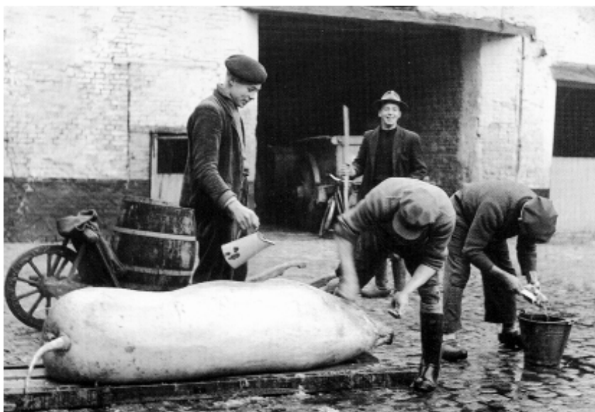
Verz. Centrum Agrarische Geschiedenis Leuven.

Het Centrum voor Agrarische Geschiedenis heeft van het Ministerie van de Vlaamse Gemeenschap projectsubsidies ontvangen voor het project 'Veldwerk/Denkwerk, Ruraal erfgoed: stand van zaken en masterplan voor Vlaanderen'. Voor de uitwerking en realisatie van dit project heeft Heemkunde Vlaanderen vzw, evenals het Vlaams Centrum voor Volkscultuur, zich bereid verklaard haar medewerking te verlenen. Daartoe hebben zij een verklaring tot partnerschap van het project ondertekend. In dit artikel zal het project kort worden toegelicht.